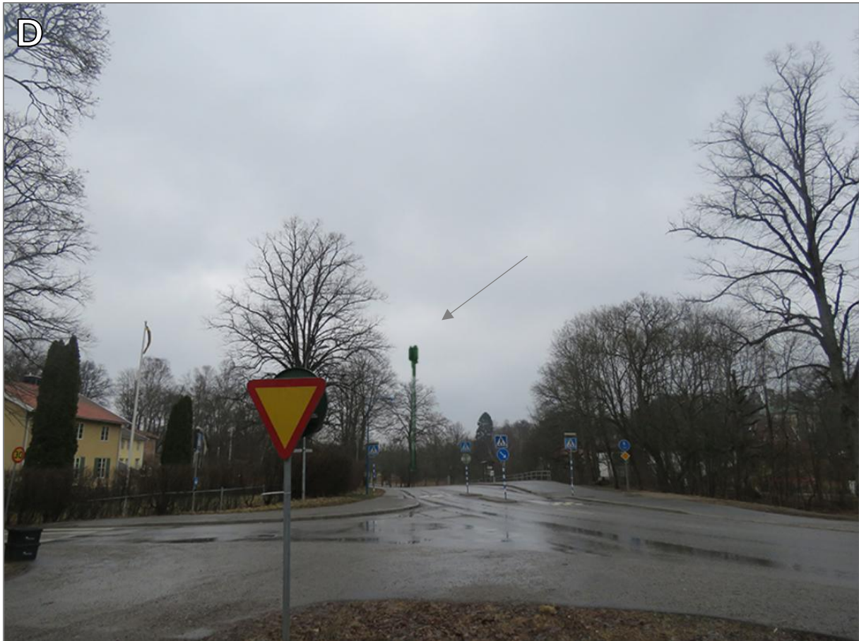
Monopolens topp förväntas sticka upp bakom träden sett från den här positionen.